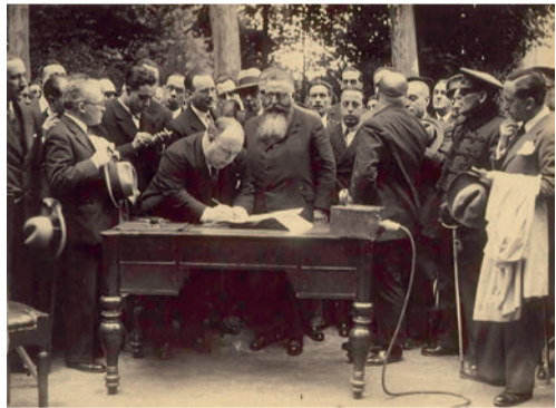
Firma en el Ayuntamiento de Madrid

Carlos III en 1772 legaliza algunas parcelas que ya estaban dentro de la Casa de Campo y encarga a Sabatini las reparaciones de la Tapia y diversos puentes. De dicha época destaca el Puente de la Culebra, conocido por su forma serpenteante, ejemplo de arquitectura barroca italiana.