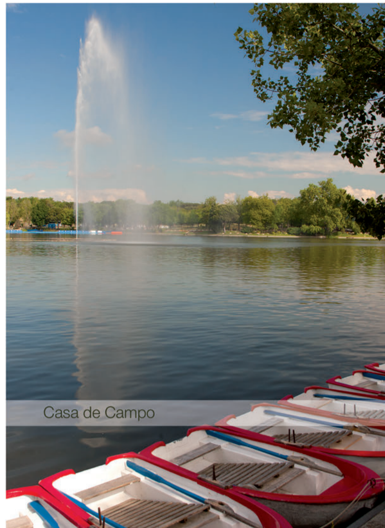
Casa de Campo