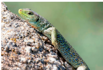
Lagarto ocellado ( Timon lepidus )

También cerca de los cauces, pero extendiéndose por sus laderas, la olmeda constituía la formación arbórea más majestuosa, hoy casi desaparecida por el ataque de una enfermedad, la grafiosis, provocada por el hongo Ceratocystis ulmi , que ha diezmado las olmedas en toda Europa.