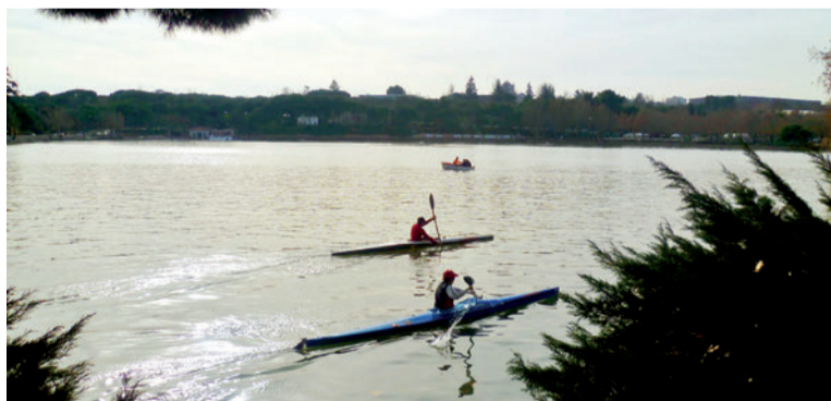
Lago de la Casa de Campo

Hoy en día la Casa de Campo es disfrutada por numerosos visitantes, especialmente los fines de semana y festivos. Es un espacio ideal para el paseo, el contacto con la naturaleza y la observación de avifauna. Además, muchos deportistas practican en el Parque senderismo, footing, ciclismo, tenis, fútbol o natación, contando para ello con diferentes instalaciones deportivas. También se celebran pruebas de atletismo, de orientación y, en el Lago, de piragüismo y de triatlón.