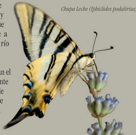
Chupa Leche ( Iphiclides podalirius )

Los materiales que conforman el terreno son mayoritariamente arenas y arcillas procedentes de la fragmentación y erosión de las rocas graníticas de la Sierra de Guadarrama.