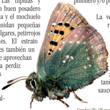
Cardenillo ( Tomares ballus )

por retamas. Constituye el hábitat de multitud de especies de fauna, como la abubilla o el zorro. Aprovechando sus frutos podemos encontrar ratones de campo, lirones careto y, sobre todo, palomas torcaes. En los huecos de los árboles se refugian y crían paseriformes como carbonero común y herrerillo común y rapaces nocturnas como cárabos y autillos. Las tupidas y cerradas copas son un buen posadero para la cigüeña blanca y el mochuelo europeo y en ellas anidan pequeñas aves como pinzones vulgares, petirrojos y verderones comunes. El estrato arbustivo y herbáceo es también un interesante refugio que aprovechan el conejo, la liebre, la perdiz y numerosos reptiles. Es destacable además su riqueza entomológica y especialmente de lepidópteros.