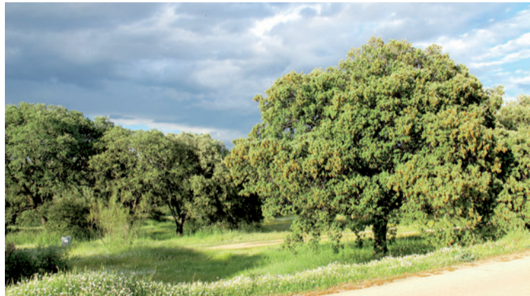
Encinar ( Quercus rotundifolia )

El encinar es la vegetación potencial de la Casa de Campo y ocupa un tercio de la superficie del Parque. Aparece de forma más o menos adhesionada, acompañado de un escaso estrato arbustivo compuesto principalmente