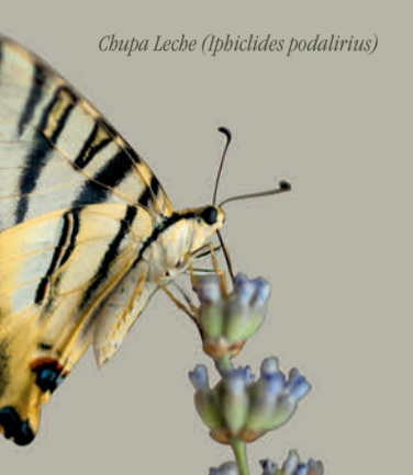
Chupa Leche ( Iphiclides podalirius )

Esta diversidad de hábitat permite una rica comunidad animal: en la Casa de Campo se han censado más de 130 especies distintas de vertebrados y más de 50 especies de mariposas.