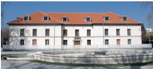
Palacio de los Vargas

De esa época es el Palacio de los Vargas que, a lo largo de la historia, ha pasado de ser casa de campo de la nobleza y la monarquía a cuartel republicano y a oficina municipal.