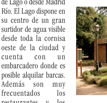
Centro de Información y Educación Ambiental de la Casa de Campo

Hoy en día la Casa de Campo es disfrutada por numerosos visitantes, especialmente los fines de semana y festivos. Es un espacio ideal para el paseo, el contacto con la naturaleza y la observación de avifauna. Además, muchos deportistas practican en el Parque senderismo, footing, ciclismo, tenis, fútbol o natación, contando para ello con diferentes instalaciones deportivas. También se celebran pruebas de atletismo, de orientación y, en el Lago, de piragüismo y de triatlón.