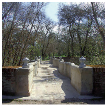
Puente de la Culebra

Fernando VII manda construir el Puente del Rey (1818) para conectar la Casa de Campo con los jardines del Campo del Moro, uniéndola con el Palacio Real. Se trata de un puente exclusivo para la monarquía y por ello apenas permite el paso para un carruaje, con unos cinco metros de anchura.