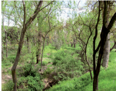
Vegetación de ribera

símbolo de fortaleza, presente en la mayor parte de los Reales Sitios y del que quedan aún buenos ejemplares. Las moreras negras y blancas, muy utilizadas en siglos pasados, todavía pueden verse con frecuencia en la zona baja del Parque. Además se conservan muchas especies introducidas en el siglo XVIII como la acacia de tres espinas, la sófora y la falsa acacia.