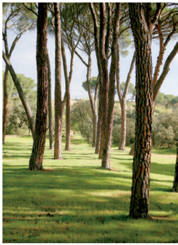
Pinar Siete Hermanas

Las coníferas ocupan extensiones importantes, cubriendo en conjunto algo menos de la mitad de la superficie del Parque, debido a las repoblaciones efectuadas y a su magnífica adaptación al suelo arenoso y al clima de la Casa de Campo. Los más interesantes son los pinares de pino piñonero y pino carrasco aunque su estrato arbustivo y herbáceo es escaso como consecuencia del uso recreativo de estas zonas. Diversos animales como la ardilla roja, el ratón de campo o el pico picapinos, aprovechan las piñas. En general, la fauna