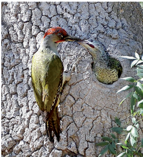
Pito real ( Picus viridis )

constituyen excelentes lugares de refugio y alimento para una variada fauna. Los tallos y rizomas de las plantas sumergidas y palustres son un lugar adecuado para que los insectos y anfibios depositen sus puestas. Las raíces de fresnos y álamos constituyen una intrincada red de galerías que usan topillos y ratones de campo. Los arbustos son utilizados por numerosas aves como zarceros, mosquiteros comunes, curruacas capirotadas y cabecinegras o mirlos que los aprovechan en algunos casos para nutrirse de sus frutos y en otros para construir sus nidos. En las oquedades de árboles añosos encuentran refugio pájaros carpinteros como el pito real y el pico picapinos y las densas copas de fresnos y álamos son un dormitorio ideal para algunos córvidos como las grajillas. En los arroyos permanentes y en las zonas remansadas es posible ver azulones, pollas de agua y martín pescador.