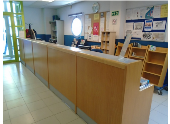
Mostrador de atención