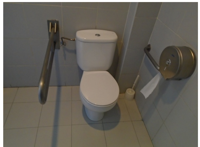
Aseo común adaptado