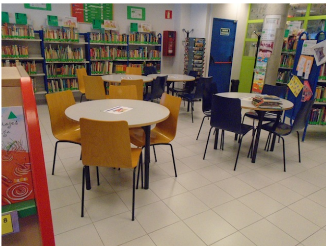
Zona de biblioteca infantil