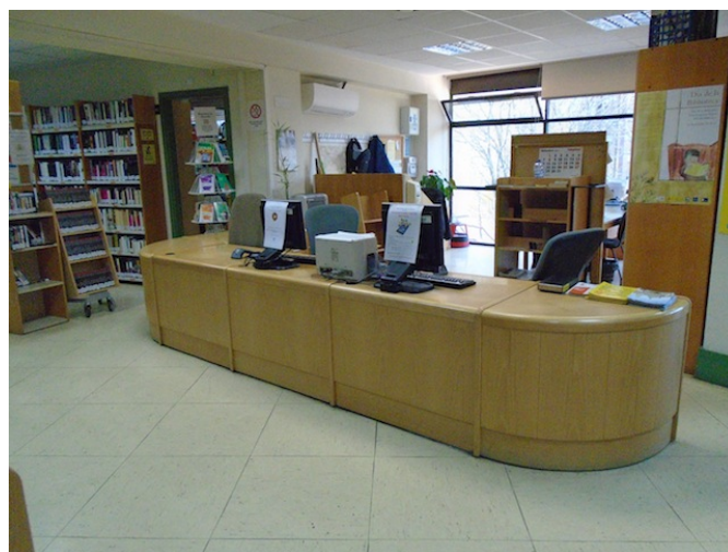
Mostrador de atención