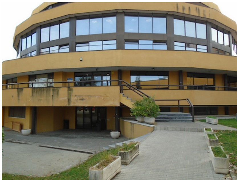
Fachada centro cultural