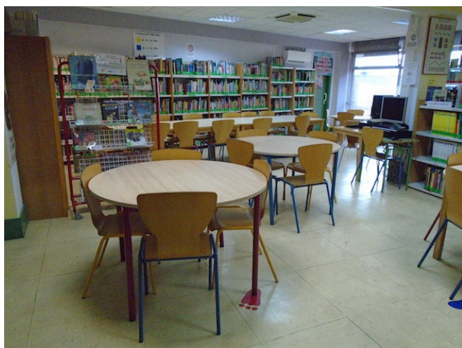
Zona de biblioteca infantil