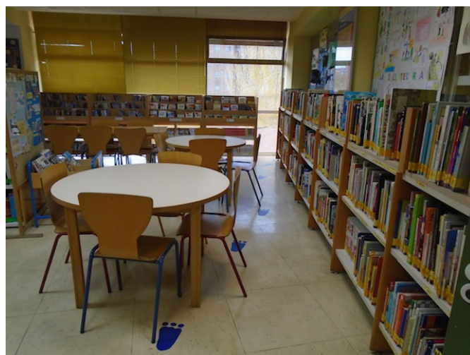
Zona de biblioteca infantil