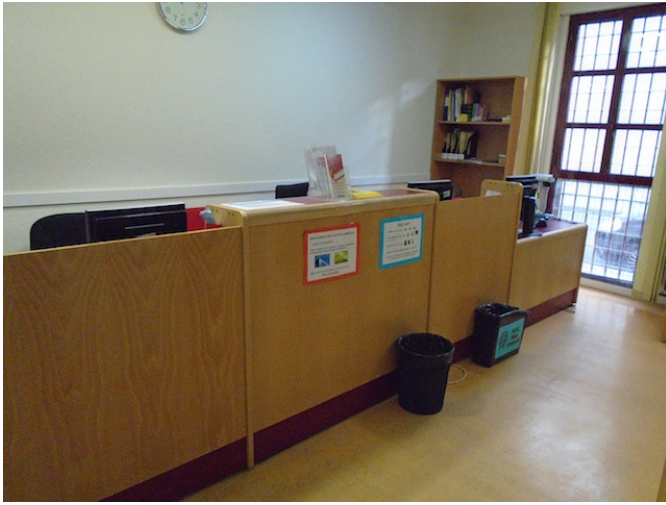
Mostrador de atención