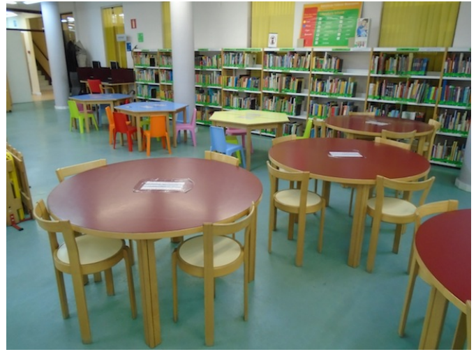
Zona biblioteca infantil