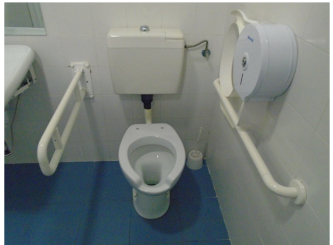
Aseo común adaptado