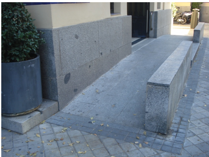
Rampa de acceso al establecimiento