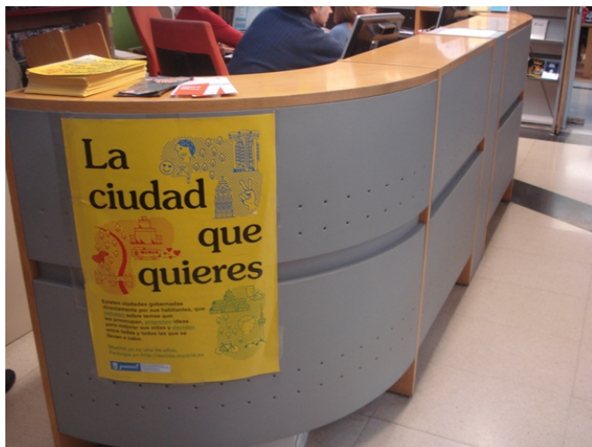
Mostrador de atención