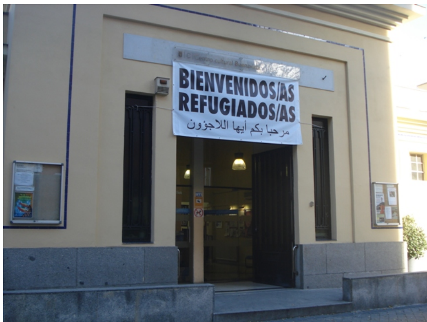
Fachada de la biblioteca