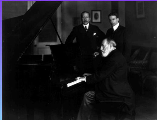
Camille Saint-Saëns al piano en 1916

En 1848 ingresó en el Conservatorio de París, donde estudió órgano con François Benoist y composición con Fromental Halévy. Su precocidad era tal que ya en 1850 había compuesto una sinfonía en la mayor y una obra coral, Les Djinns , sobre un poema de Victor Hugo. En 1853 ganó un concurso con Ode à Sainte Cécile y comenzó su trayectoria profesional como organista en Saint-Merry, pasando en 1857 a convertirse en organista de la Madeleine, el puesto más prestigioso de Francia. Franz Liszt llegó a llamarlo “el mejor organista del mundo”, cristalizando una admiración que se transformó en una amistad profunda