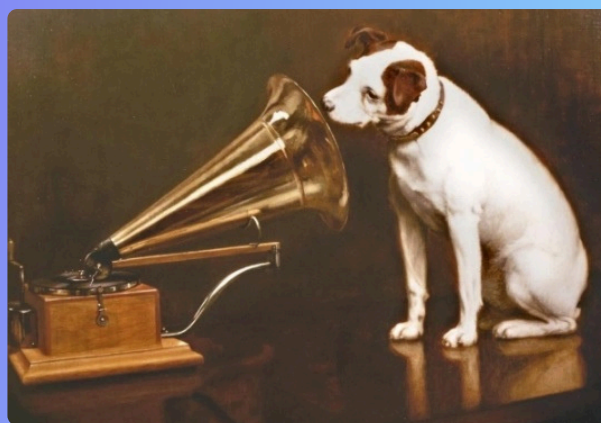
Cuadro modificado, en el que aparece un gramófono

La marca His Master's Voices se introdujo oficialmente como denominación comercial de la empresa y fue usada tanto para gramófonos como para discos. La compañía difundió amplios catálogos de aparatos y repertorios durante las décadas de 1920 y 1930, incorporando innovaciones como bocinas internas y los primeros dispositivos eléctricos demostrando el avance tecnológico de la casa en el ámbito doméstico y profesional.