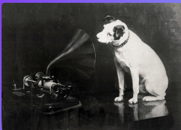
Cuadro original, con un fonógrafo

La discográfica La Voz de su Amo —conocida internacionalmente como His Master's Voice , mismo título en inglés— surgió como marca vinculada a The Gramophone Company, reorganizada en 1899 y convertida en una de las compañías pioneras de la industria fonográfica. El nombre procede directamente del célebre cuadro His Master's Voice , pintado en 1899 por Francis Barraud, pintor y fotógrafo británico, en el que el perro Nipper aparece escuchando la voz de su amo (el difunto hermano de Barraud) reproducida en un aparato. La pintura original mostraba un fonógrafo de cilindro, pero la compañía discográfica pidió al artista que lo sustituyera por un gramófono, más representativo de su tecnología; comprando la obra y sus derechos por 100 libras (unos 17.000 euros de ahora) . La fuerza visual del perro escuchando la voz de su antiguo dueño —una escena tierna, humana y técnicamente fascinante— hizo que se convirtiera en logotipo y que se volviera omnipresente en gramófonos, discos y material publicitario, adoptada de inmediato como símbolo corporativo y transformada en uno de los iconos más reconocibles de la historia de la música grabada.