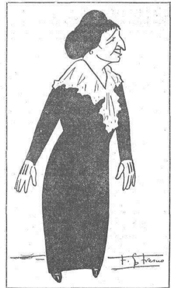
SRTA. MARIA RODRIGO - Autora de la partitura de la ópera "Becqueriana", estrenada en el Teatro de la Zarzuela (Caricatura de Fresno)

En 1915 se convirtió en la primera mujer española que logró estrenar una ópera en España Becqueriana, aunque no la primera en escribir una, puesto que Luisa Casagemas Coll había compuesto Schiava e Regina, obra que no llegó estrenarse debido al atentado del Liceo de 1892. María Rodrigo estrenó la ópera en el Teatro de la Zarzuela el 9 de abril de 1915, con libreto de los hermanos Álvarez Quintero, inspirado en la Rima XI de Gustavo Adolfo Bécquer. Las críticas recibieron favorablemente la obra, como la aparecida en La mañana el 10 de abril