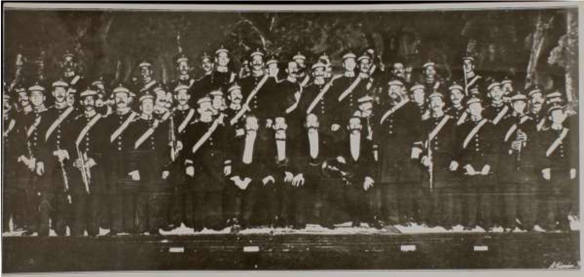
Concierto de presentación de la Banda Municipal de Madrid en el Teatro Español el 2 de junio de 1909.

primera vez a la Banda Municipal Valenciana. A su regreso a Madrid propone la creación de un Organismo Sinfónico madrileño dependiente del Ayuntamiento.