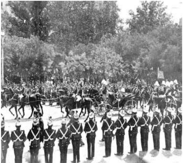
Comitiva de los Reyes de Italia. Mundo Gráfico, 11 de junio de 1924

Dicha gala comenzó a las 22:00 horas presentando el teatro un aspecto majestuoso dadas las personalidades que esa noche acogía en sus palcos.