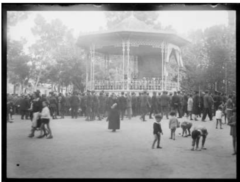
Actuación de la Banda Municipal en el Quiosco de Retiro. 1928. memoriademadrid

El programa que este mes os presentamos forma parte de este fondo antiguo. Y se constituye como un testigo esencial de la sociedad coetánea. Gracias a la labor de recolección que desde su fundación lleva a cabo nuestra biblioteca, nos ha llegado un documento prácticamente único y gracias a él, podemos conocer las obras musicales que aquel 8 de junio tan lejano pudieron disfrutar personalidades tan importantes de la sociedad.