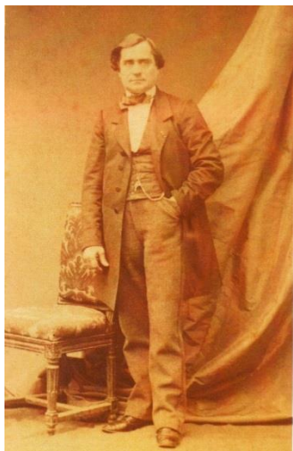
Fotografía de Alexandre-François Debain

Alexandre-François Debain nació en París el 6 de julio de 1809. Inició su formación con doce años como aprendiz de orfebre y con dieciséis años continuó su formación en distintos talleres de pianos. En 1833 funda un taller dedicado a la construcción de pianos verticales y trabaja en distintas invenciones mecánicas.