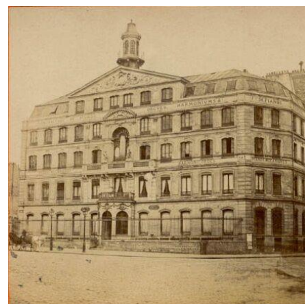
Fábrica de órganos de Debain en París.

La fábrica continuó su actividad fusionada con Rodolphe bajo el nombre Maison Rodolphe Fils et Debain.