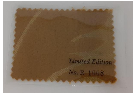
Fragmento numerado del telón