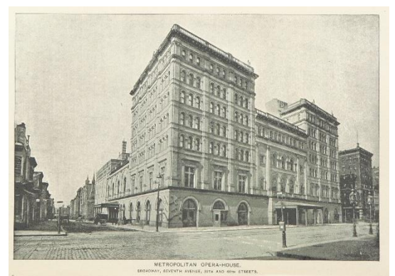
Metropolitan en la calle 39

Desde su apertura era evidente que el teatro ofrecía limitados recursos escénicos. El espacio auxiliar de escenarios era escaso, por lo que cuando se realiza la reforma urbanística del Lincoln Center en el Upper West Side se decide su traslado. El conocido como Old Met cerró el 16 de abril de 1966 y fue demolido al año siguiente para construir un edificio de oficinas. El nuevo Met en el Lincoln Center, mucho más grande y moderno, fue inaugurado el 16 de septiembre de 1966 con el estreno de la ópera Antonio y Cleopatra .