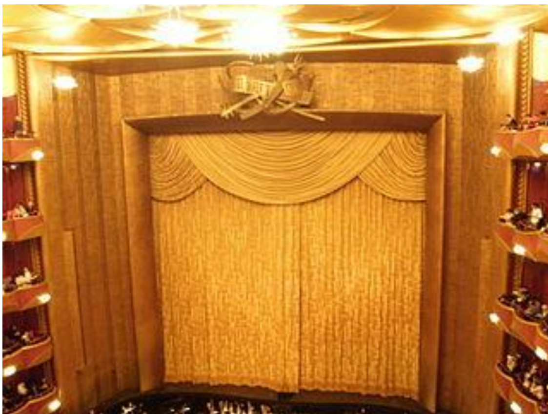
Telón dorado donado por The Metropolitan Opera Club

Entre estos proyectos figura la donación de un telón realizado en seda dorada por la prestigiosa casa americana Scalamandre que fue instalado en 2005. Previamente, en 1979 habían realizado la donación de un telón dorado para el escenario. Del telón sustituido procede el fragmento numerado que acompaña esta edición discográfica.