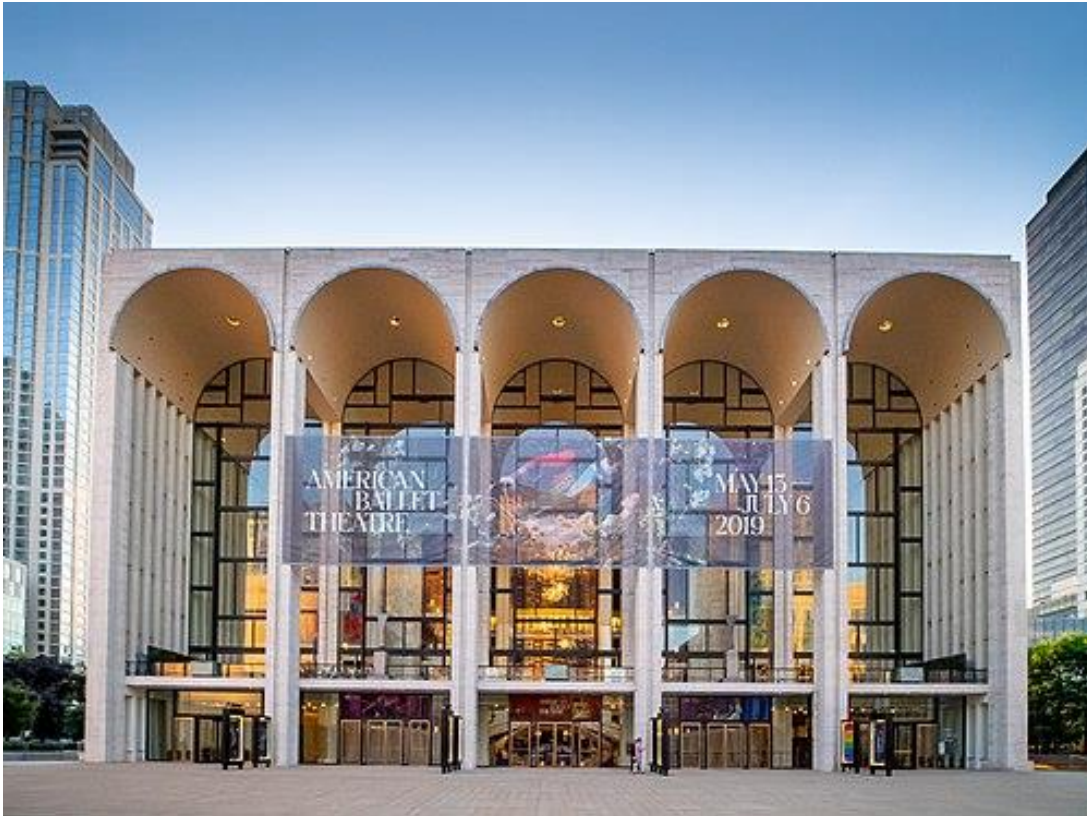
The Metropolitan Opera House en el Lincoln Center

OPENING NIGHTS AT THE MET: historic recordings of Metropolitan Opera Stars re-creating their celebrated opening night roles. Limited Edition. RCA Victor. 1966